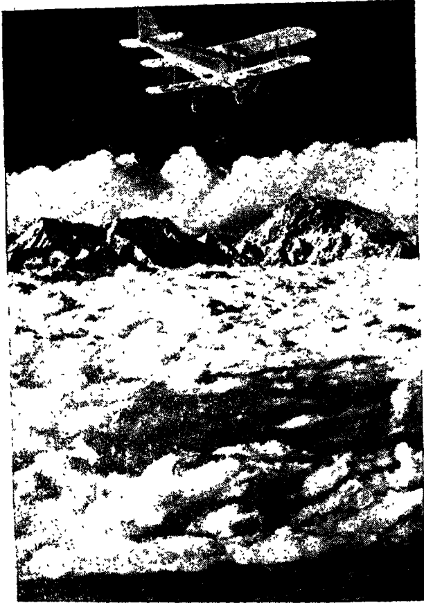
हिमालयपर हवाई खदाई

उस समय एक्स्ट्रेके चारों और जबरदस्त धुन्ध छाया हुआ था। धुन्धके कारण आसपासकी चीजोंको देखना भी मुश्किल था। दोनों